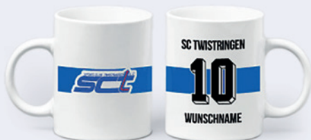
Tasse Spielmacher 12,95 €