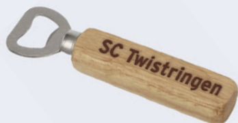
Flaschenöffner Zisch 9,95 €